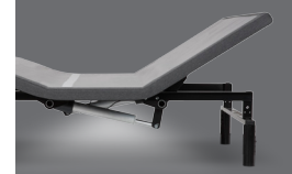
Veilleuse sous le lit

Offertes dans les tailles suivantes: Lit simple, Lit simple TG, Lit double, Lit double TG, Grand lit, Grand lit divisé et TG lit Californie divisé.