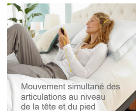
Mouvement simultané des articulations au niveau de la tête et du pied

Offertes dans les tailles suivantes: Lit simple, Lit simple TG, Lit double, Lit double TG, Grand lit, Grand lit divisé et TG lit Californie divisé.