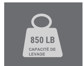
850 LB CAPACITÉ DE LEVAGE