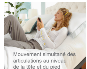
Mouvement simultané des articulations au niveau de la tête et du pied

Offertes dans les tailles suivantes: Lit simple, Lit simple TG, Lit double, Lit double TG, Grand lit, Grand lit divisé et TG lit Californie divisé.