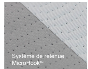
Système de retenue MicroHook™